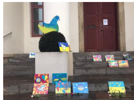
Rathaustrappe Feb. 2022

Außerdem wurden in einer zweiten Aktion Sachspenden für die Menschen in der Ukraine gesammelt. Während die älteren Schülerinnen und Schüler in Geschäften und Apotheken um Spenden wie Medikamente und Hygieneartikel baten, brachten die Grundschulkinder Spenden von zu Hause mit, z.B. Windeln, Flüssigseife, Zahnbürsten, Taschenlampen und Regenponchos. Für die Verteilung vor Ort wurden die Kartons von außen beschriftet, nicht nur in deutscher, auch in ukrainischer Sprache.